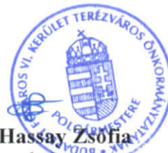
Hassay Zsófia polgármester

Budapest Főváros VI. kerület Terézváros Önkormányzata